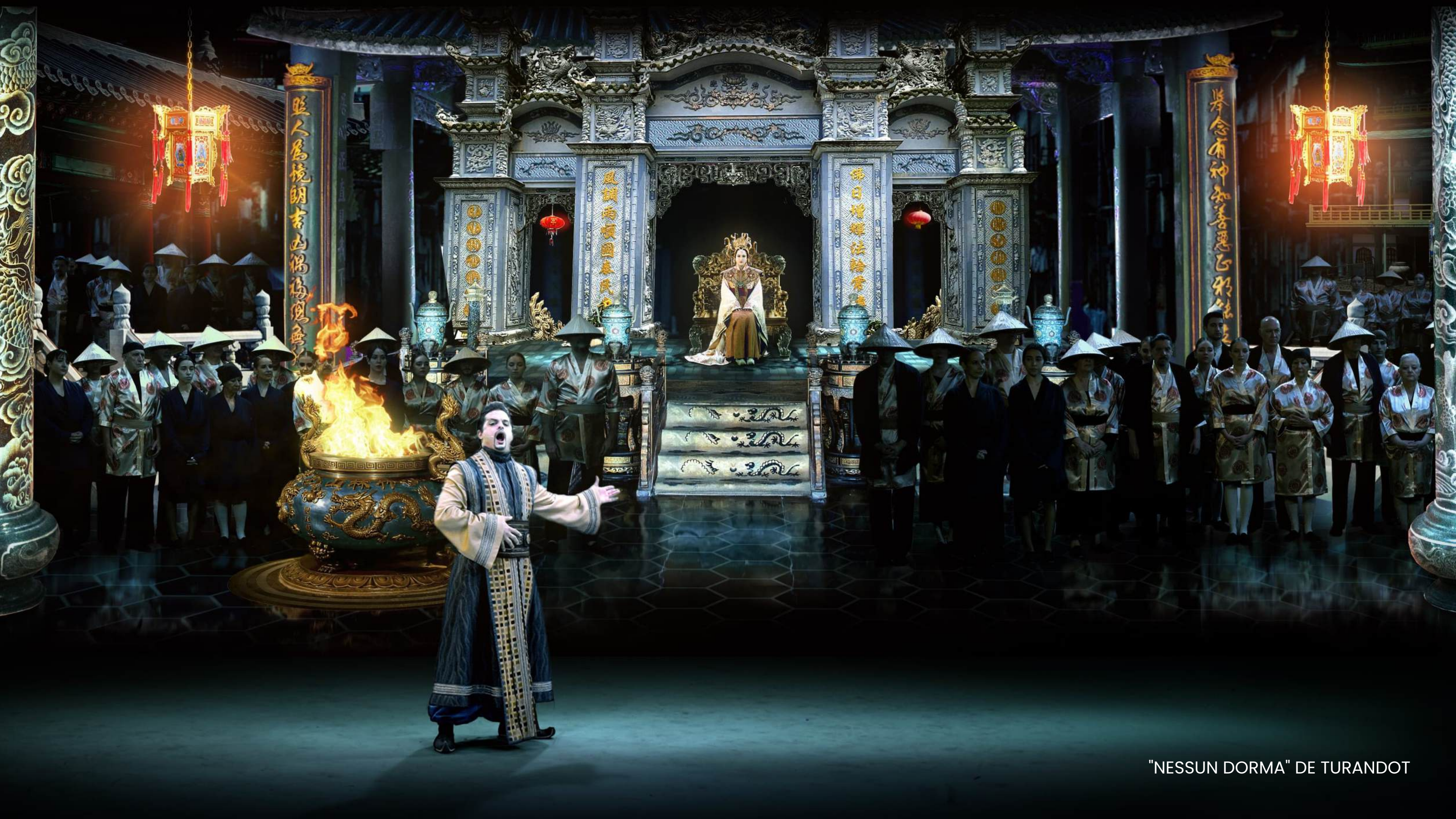
"NESSUN DORMA" DE TURANDOT