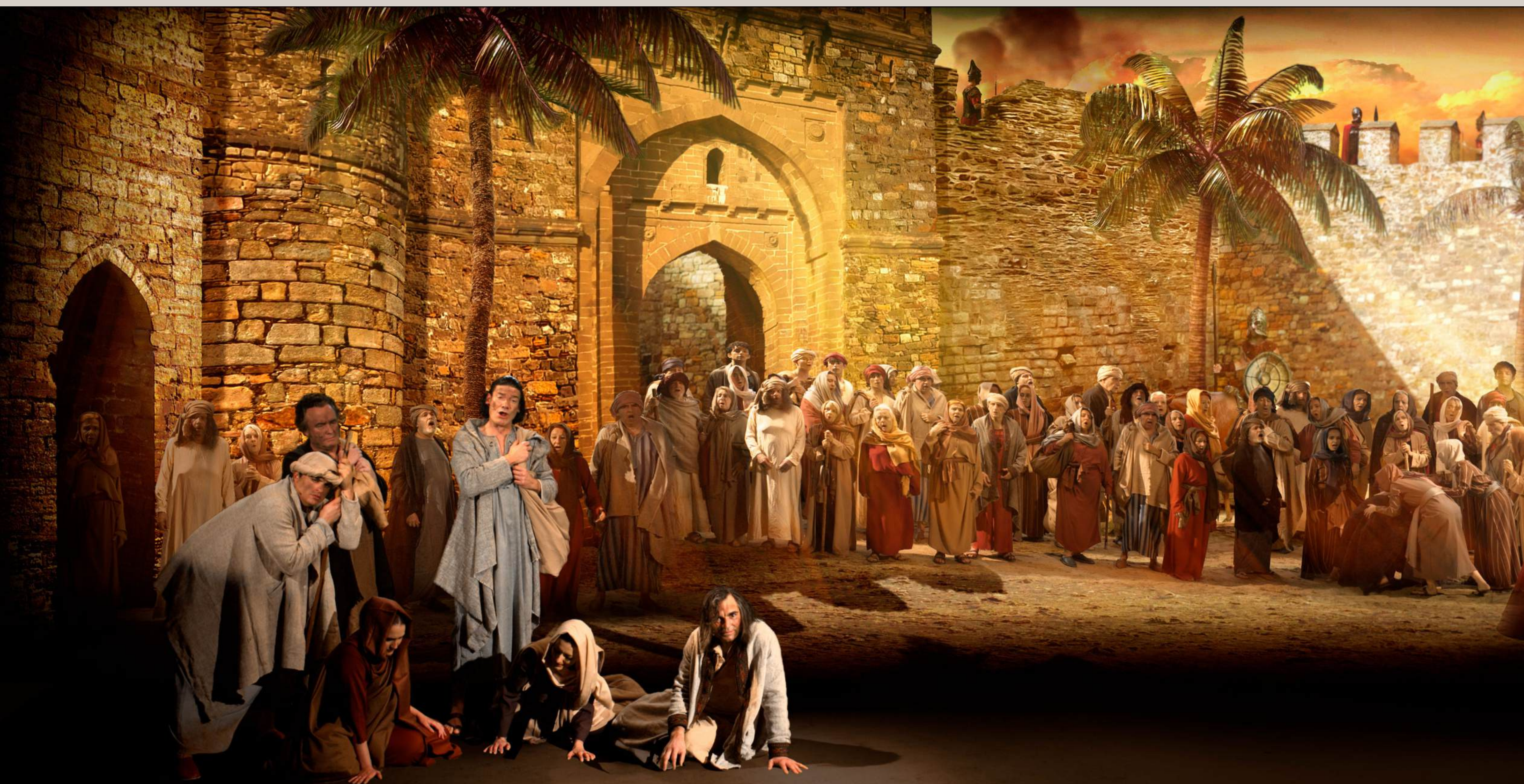
"VA PENSIERO" DE NABUCCO