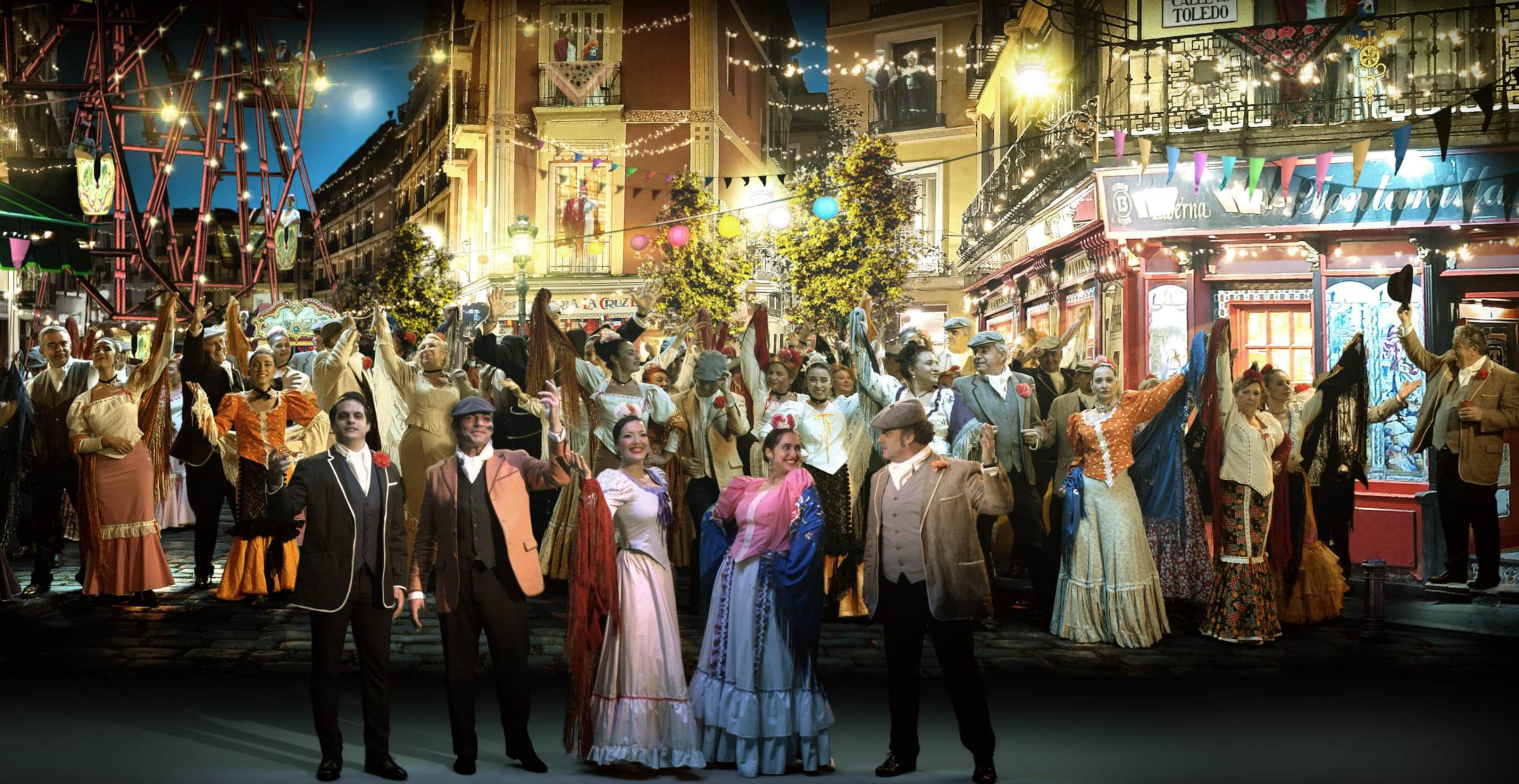
LA VERBENA DE LA PALOMA "OBERTURA"