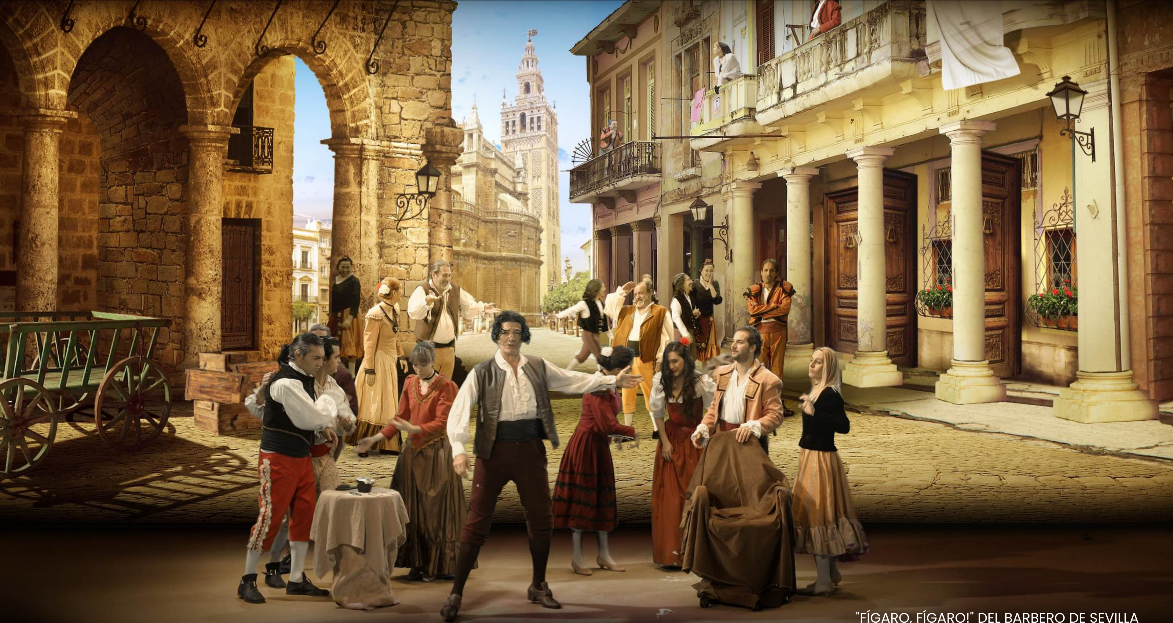
"FÍGARO, FÍGARO!" DEL BARBERO DE SEVILLA